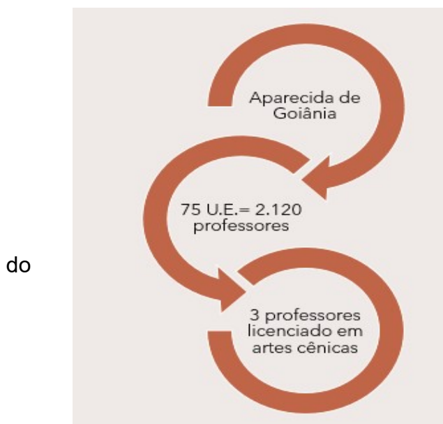
Imagem 2-Quantitativo de professores município de Aparecida de Goiânia

E nesse quadro de professor do estado de Goiás, foi filtrado a CRE de Aparecida de Goiânia, para apresentar os dados e demonstrar que essa regional conta com 75 unidades escolares, 2.120 professores graduados em licenciaturas de todas as áreas do conhecimento e somente três professores licenciados em Artes Cênicas, sendo um efetivo e dois contratos. Apenas três Escolas estaduais contam com esses especialistas, e as demais escolas dessa Coordenação Regional -CRE Aparecida de Goiânia, os docentes que ministram aulas de teatro, são formados em licenciaturas que não são da área de teatro. Como apresenta o desenho a seguir.