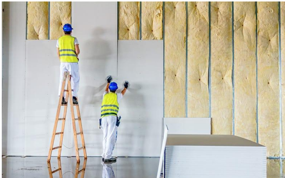
Figura 1 – Instalação do drywall.